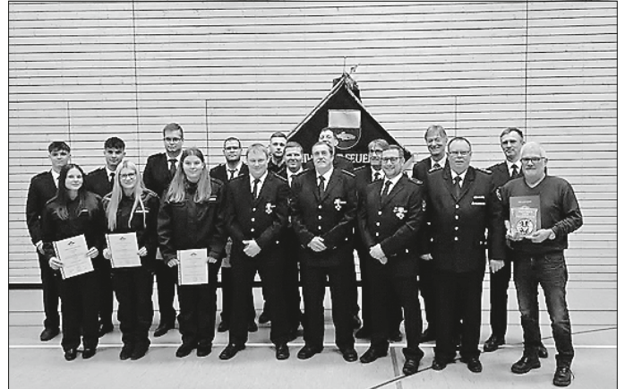
Alle Geehrten der HV 2025