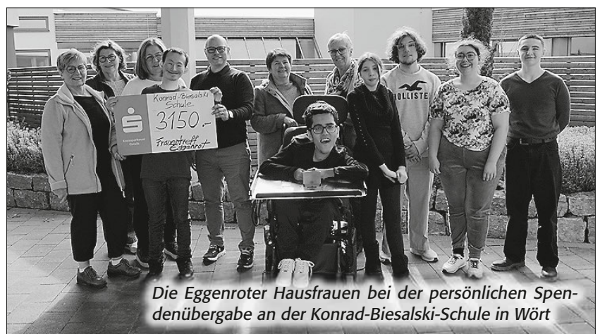
Die Eggenroter Hausfrauen bei der persönlichen Spendenübergabe an der Konrad-Biesalski-Schule in Wört