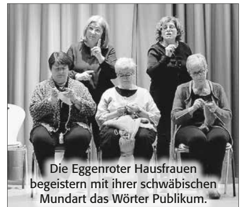
Die Eggenroter Hausfrauen begeistern mit ihrer schwäbischen Mundart das Wörter Publikum.

Dank dem großen Interesse an der Veranstaltung kam eine erfreuliche Spendensumme von stolzen 3150 Euro zusammen. Im Rahmen einer kleinen Spendenübergabe wurde diese Summe bereits offiziell an den Förderverein der KBS übergeben und kommt nun schulischen Projekten und Anschaffungen zugute.