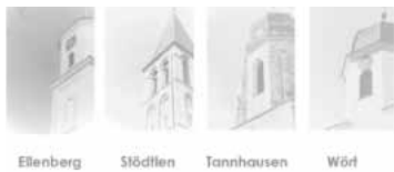
Ellenberg Stöttlen Tannhausen Wört