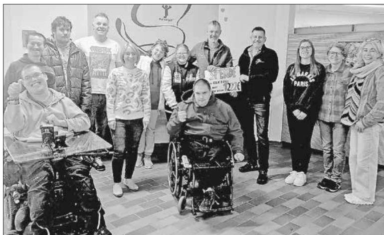
Die Organisation „Hope for Africa“ erhält den Erlös des Guggenkonzerts an der Konrad-Biesalski-Schule.

Der Erfolg des Benefizkonzerts „Guck a Gugg“ ist insbesondere dem Engagement der Schülerinnen und Schülern, Lehrkräften und zahlreichen Helferinnen und Helfern zu verdanken. Nach der Spendenübergabe kamen deshalb alle Beteiligten des Konzerts zum traditionellen Pizzaessen im Internat zusammen, um nochmals gemeinsam zu feiern.