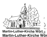
Martin-Luther-Kirche Wört Martin-Luther-Kirche Wört