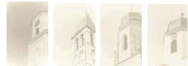
Ellenberg Stöttlen Tannhausen Wört