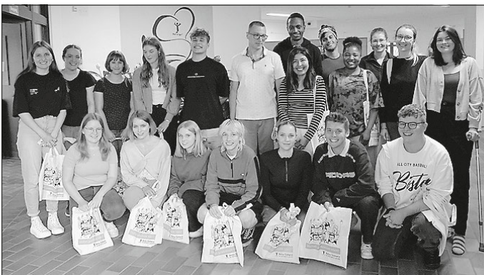
Auch viele junge Erwachsene verabschiedeten sich mit dem Ende des Schuljahres aus ihrem Freiwilligendienst.