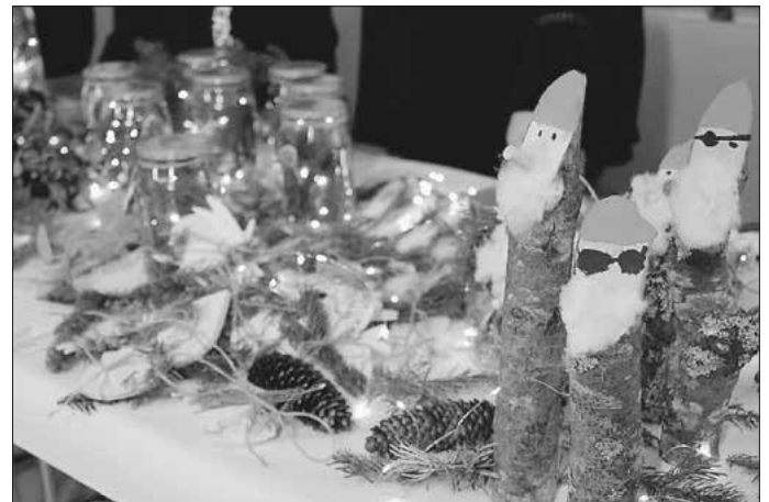
Weihnachtliche Dekoartikel, Punsch und ein Essensstand laden zum Verweilen ein.

In diesem Jahr findet der Verkauf sowohl in der Schulaula des Hauptbaus als auch im Berufsschulstufenneubau statt. Hier verkaufen die Schülerinnen und Schüler der Berufsschulstufe ihre Weihnachtsartikel - eine gute Gelegenheit, um das Gebäude zu besichtigen. Für das leibliche Wohl sorgt an diesem Tag auch der Elternbeirat mit Grillwürsten und Leberkäswecken. Vorbeikommen lohnt sich also, denn Weihnachten steht vor der Tür.