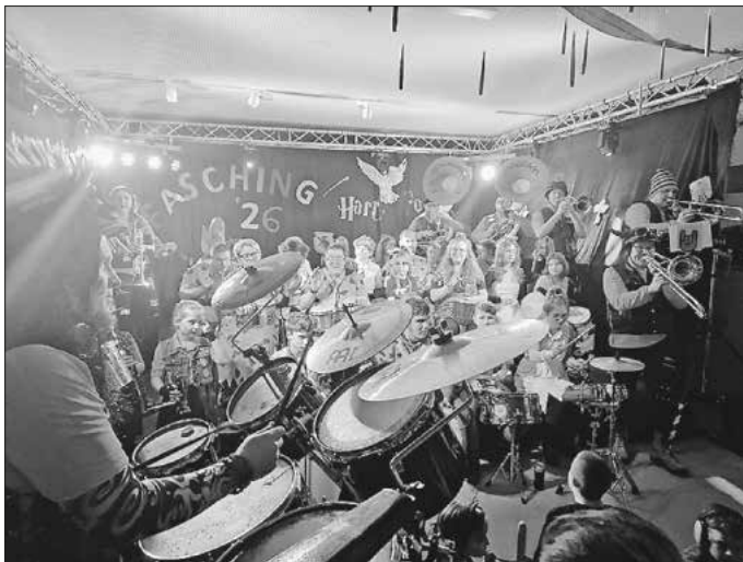
Seit Jahren Highlight beim traditionellen Guggenkonzert ist der gemeinsame Auftritt der Wörter „Rotachgugga“ mit der KBS-Internatsband