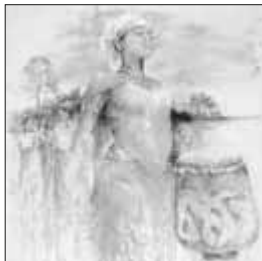
Künstlerin: Sri Irodikromo

Der ökumen. Kinderchor wirkt mit. Das Vorbereitungsteam lädt herzlich dazu ein.