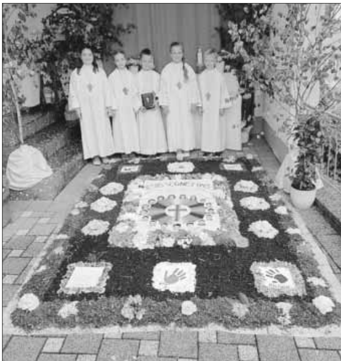
Ein herzliches „Vergelts Gott“ gilt allen, die wieder mit viel Liebe und Zeit diese wundervollen Blumenteppeiche für Fronleichnam gelegt haben.

Die Stiftung WegZeichen – LebensZeichen – GlaubensZeichen lobt Preis aus für geschaffene religiöse Wegzeichen mit bis zu 2000 Euro