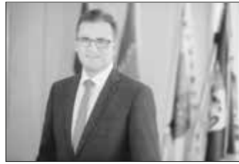
Landrat Dr. Joachim Bläse ruft die Bürgerinnen und Bürger im Ostalbkreis auf, von ihrem Wahlrecht bei der Landtagswahl regen Gebrauch zu machen.

Unsere Städte und Gemeinden sorgen in den Wahllokalen für die Einhaltung der coronabedingt erforderlichen Abstands- und Hygienemaßnahmen. Darüber hinaus gilt für alle Wählerinnen und Wähler sowie für alle ehrenamtlich tätigen Wahlhelferinnen und Wahlhelfer, dass im Wahllokal die Pflicht zum Tragen einer medizinischen Maske oder einer FFP2-Maske besteht. Ausnahmen sind nur mit ärztlicher Bescheinigung oder wegen eines sonstigen zwingenden Grundes möglich. Wer keine Maske trägt und auf wen keine Ausnahme zutrifft, kann nicht im Wahllokal wählen. Wer Symptome einer COVID-19-Infektion wie Fieber, trockenen Husten oder eine Störung des Geschmacks- oder Geruchssinns hat oder in den letzten 14 Tagen vor der Wahl Kontakt zu einer infizierten Person hatte, darf nicht vor Ort im Wahllokal wählen. Wer kurzfristig erkrankt oder unter Quarantäne gestellt wird, kann noch am Wahltag bis 15.00 Uhr Briefwahl bei seiner Kommune beantragen.