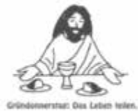
Gründonnerstag: Das Leben teilen.

mit Übertragung des Allerheiligsten und Altarentblößung