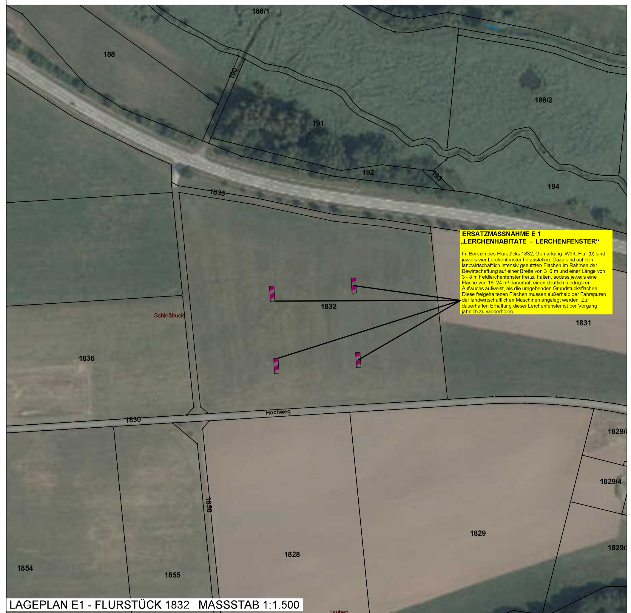
LAGEPLAN E1 - FLURSTÜCK 1832 MASSSTAB 1:1.500